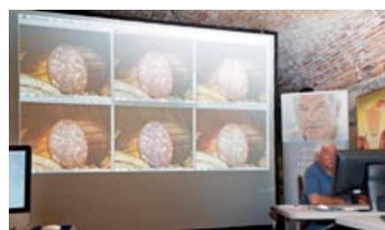
Un momento della valutazione delle immagini