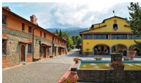
La piazzetta principale della Fattoria

Advanced Applied Color Theory in Photoshop by Dan Margulis - 21-23 ottobre 2012