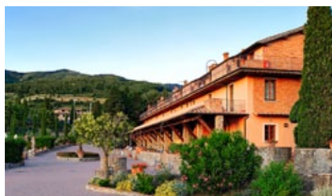
Il ristorante e la zona congressuale con le aule