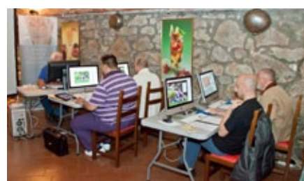
Un momento delle esercitazioni pratiche