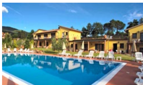
La Country House con le camere degli allievi